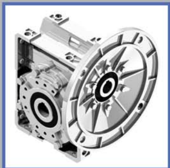
Червячные редукторы в кубическом корпусе